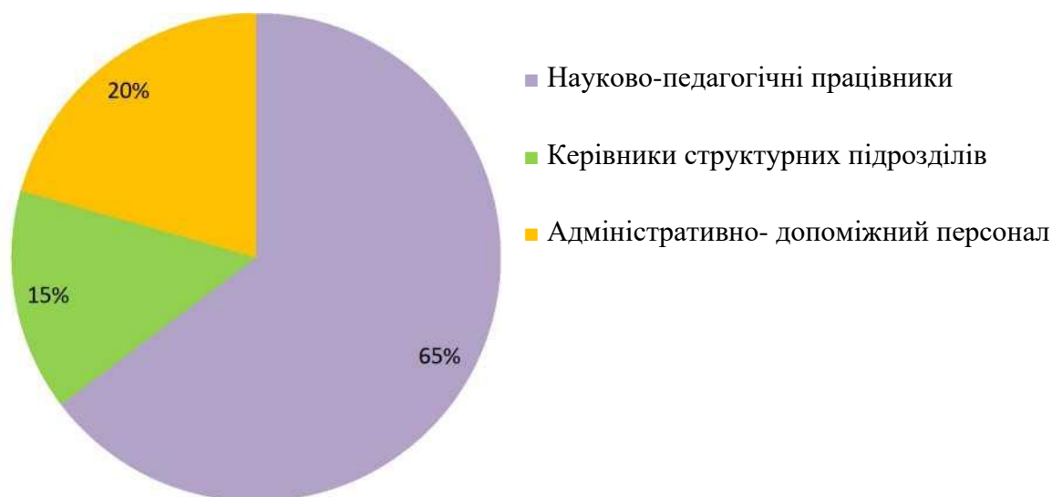
Рис. 1. Структура працівників ТОВ «Київський інститут сучасної психології та психотерапії» за 2023 рік, %

Розглянувши рисунок 2, можна проаналізувати кількісний та якісний склад науково-педагогічного персоналу за основним місцем роботи, протягом 2023 року становить: викладачі. Які мають науковий ступінь доктора наук - 36%, науковий ступінь кандидата наук - 64%, у загальному з науковим ступенями та вченими званнями 100% викладачів. В сукупності основу частку науково-педагогічного персоналу Київського інституту сучасної психології та